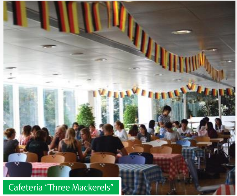
Cafeteria "Three Mackerels"