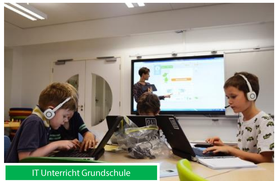
IT Unterricht Grundschule