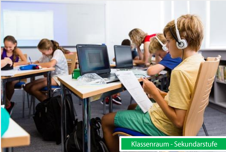
Klassenraum - Sekundarstufe